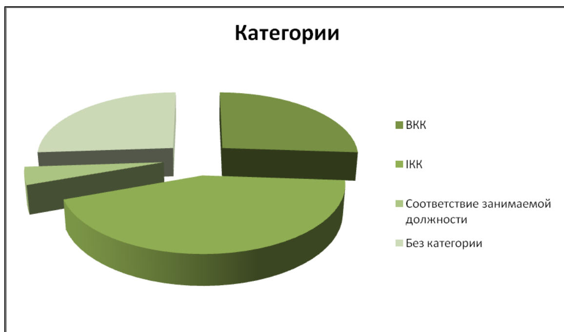
Рис. 2. Качественный состав педагогических работников МБОУ ООШ №28 города Белово